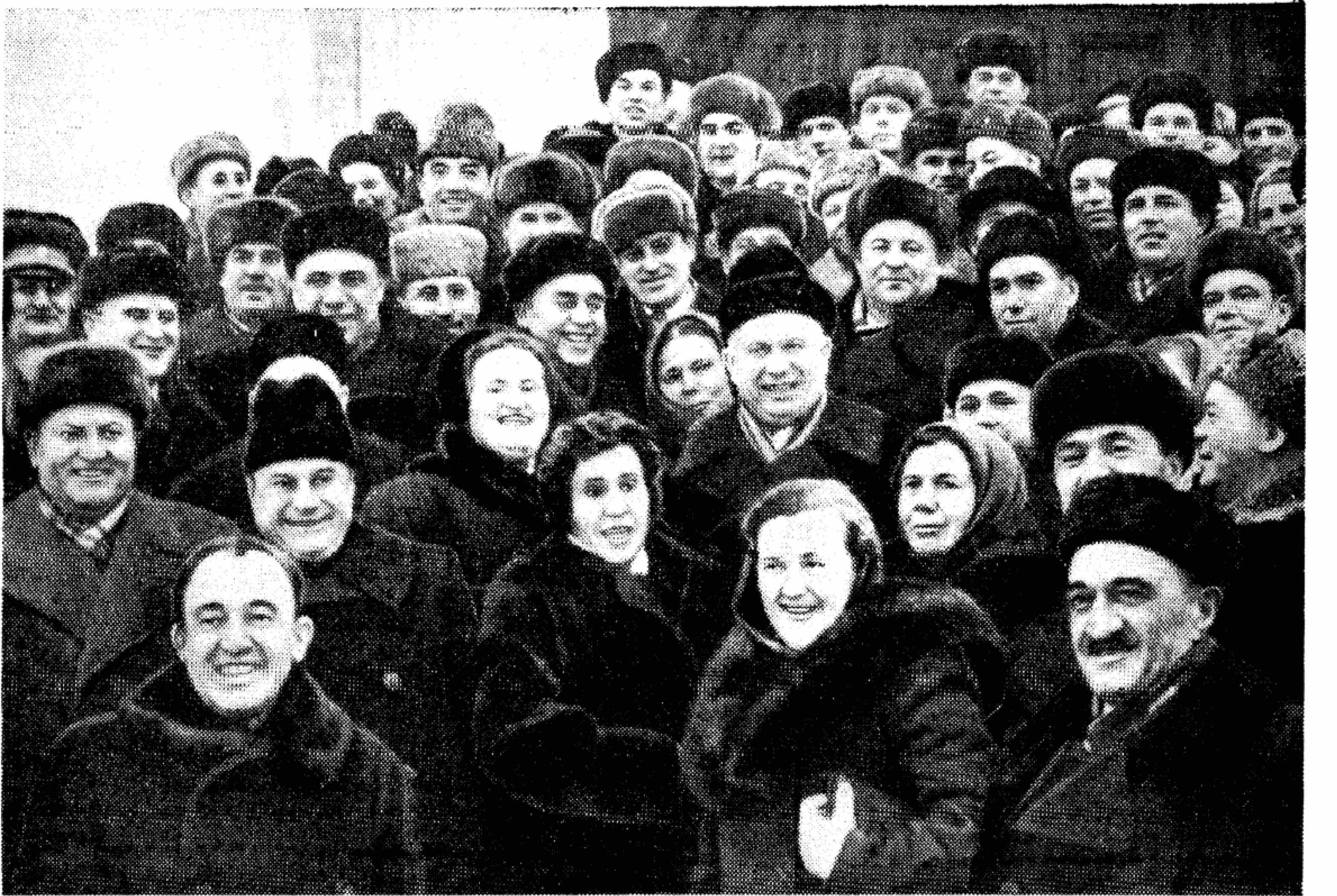
Вчера в перерыве между заседаниями XXI съезда партии товарищи Н. С. Хрущев, А. И. Кириченко и А. И. Микоян сфотографировались среди делегатов съезда и экскурсантов Московского Кремля.